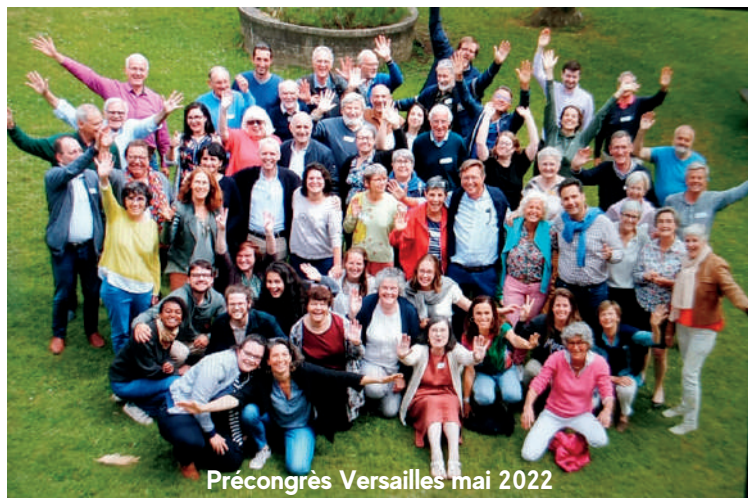
Précongrès Versailles mai 2022