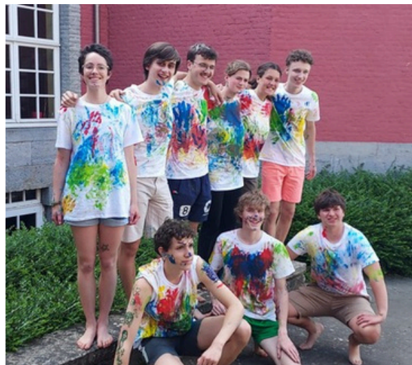
La nouvelle équipe des animateurs 11-14

La joie, la peur, la tristesse, la colère...Vivre ses émotions, les accueillir et les comprendre. Pour mieux se connaître et comprendre les autres.